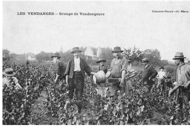
Vendangeurs en 1900