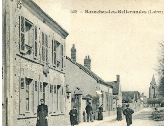
Etude notariale BLG