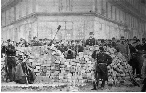
La Commune de Paris 1848