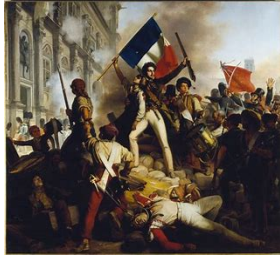
Révolution de 1830